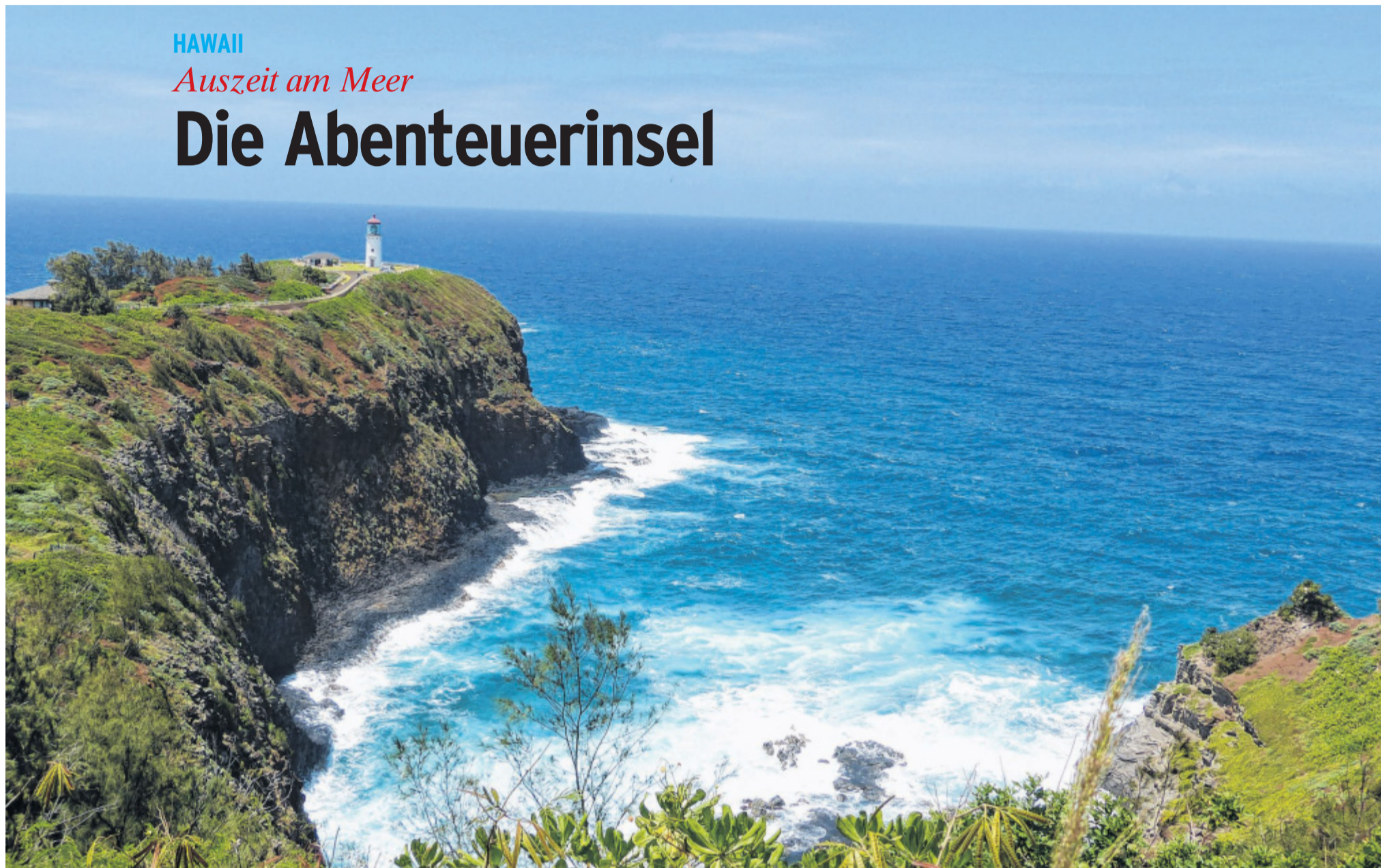
Paradiesisch: Kauai, die Garteninsel, ist die älteste Insel Hawaiis. Sie hat zahlreiche fantastische Aussichten zu bieten.