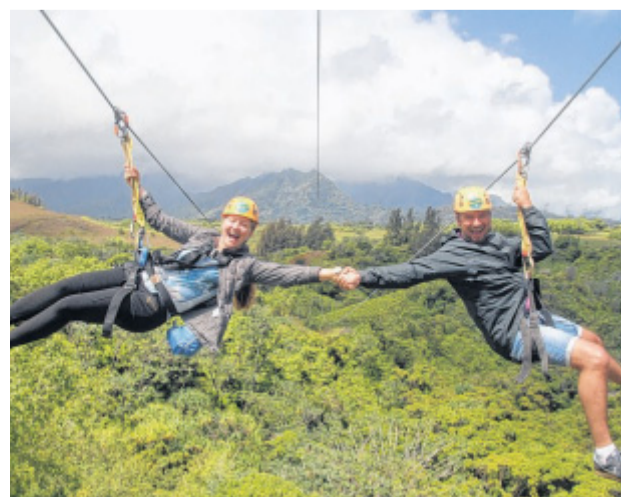
Atemberaubend: Im Duo am stählernen Faden durch das grüne Eldorado der Insel Kauai gleiten.

Das Ensemble kreist sanft umeinander, balzt und flirtet so zart miteinander, dass der Betrachterin wahrhaftig der Mund vor Staunen offen stehen würde, geriete damit nicht der Schnorchel außer Kontrolle. Ein magisches Naturschauspiel, das tief berührt und verzaubert. Der Mantarothen, englisch: manta ray, gibt seine Performance. Alles fließt. Im Ozean ist alles im Fluss. Aber nicht nur dort. Aufsteigen, abtauchen, loslassen. Hawaii macht's möglich. Aloha.